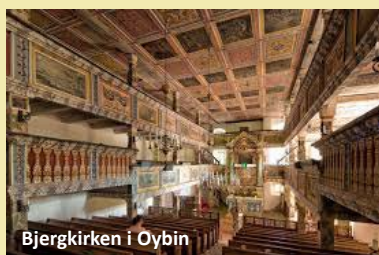
Bjergkirken i Oybin