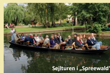
Sejlturen i „Spreewald“