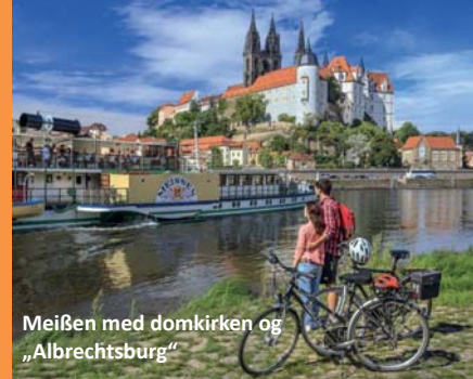
Meißen med domkirken og „Albrechtsburg“

Og nyt i rejse C-2 er Dresden med „Frauenkirchen“, Besøg på slaveborgen Raddusch og meget mere.