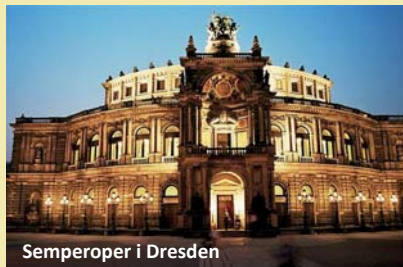
Semperoperen i Dresden

Forbehold for pristillæg på andre dage samt i.f.m bl.a. helligdage, byarrangementer, messer og lign.