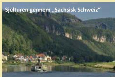
Sjelturen gennem „Sachsisk Schweiz“