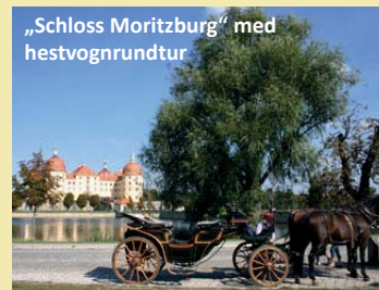
„Schloss Moritzburg“ med hestvogntur