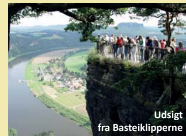
Udsigt fra Basteiklipperne