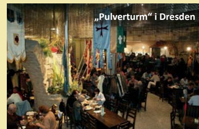
„Pulverturm“ i Dresden